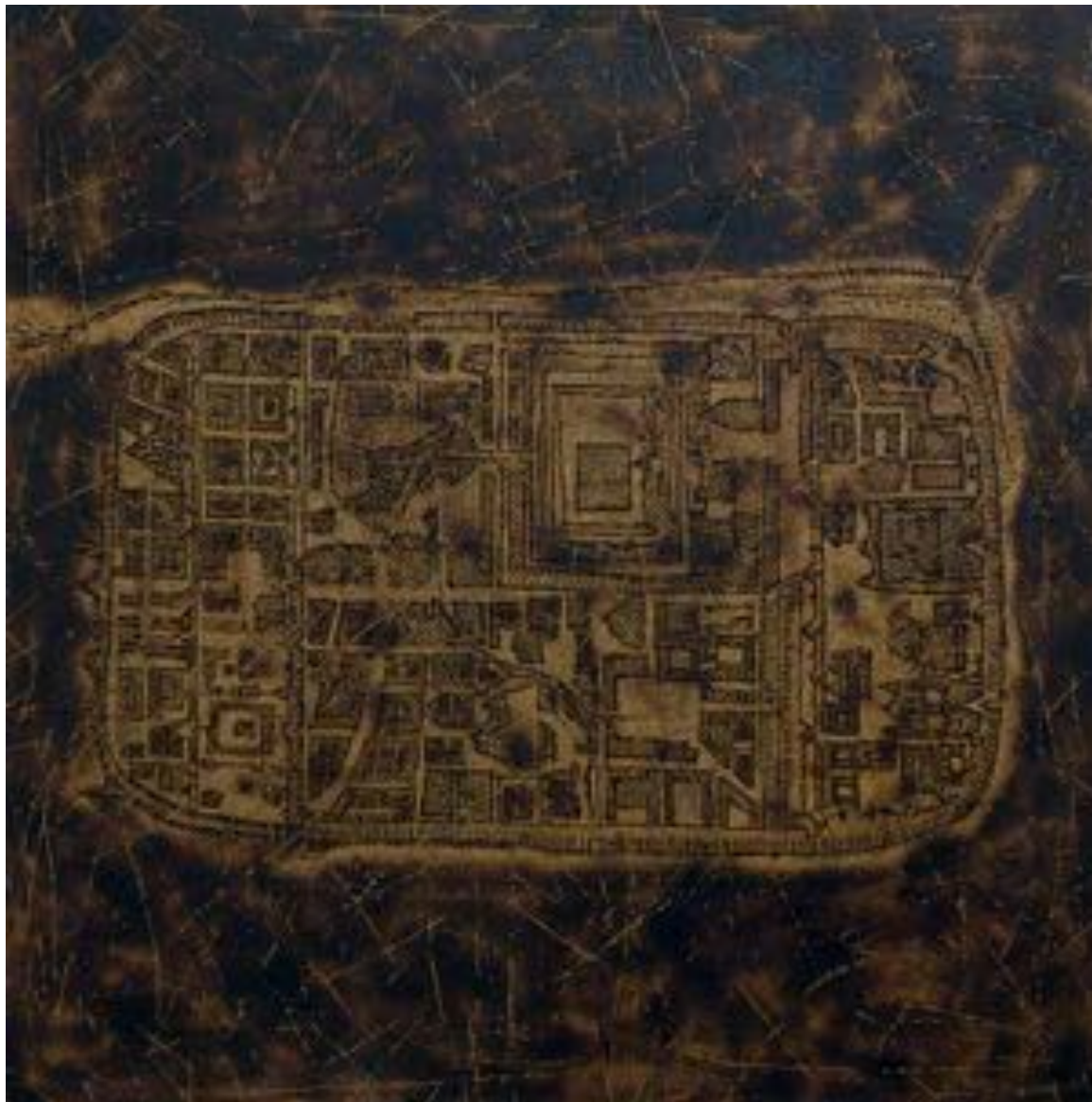
950sq.m. No. 18, 2017 < 950 מ"ר מס' 18, 2017