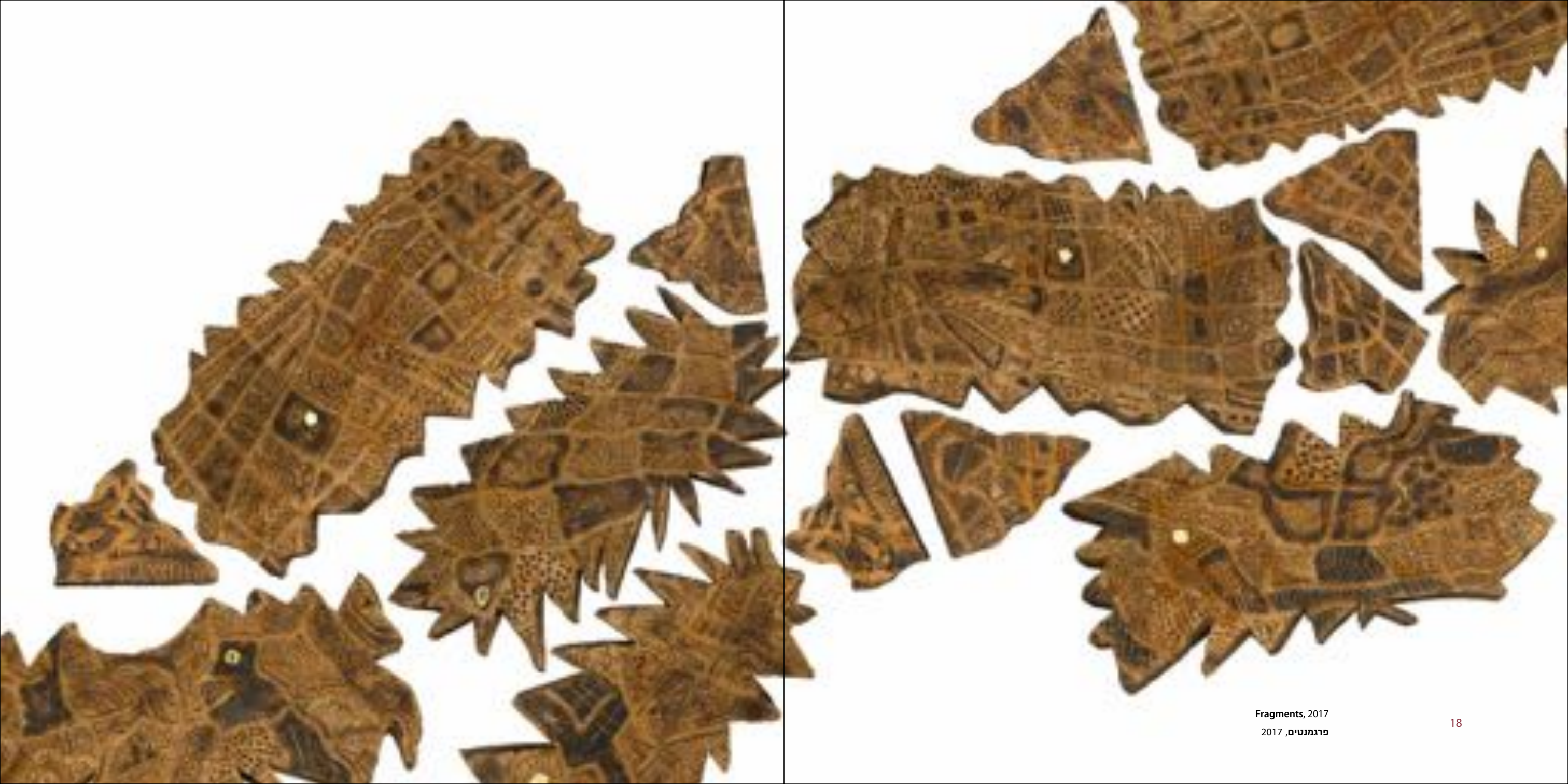
Fragments, 2017 פרגמנטים, 2017