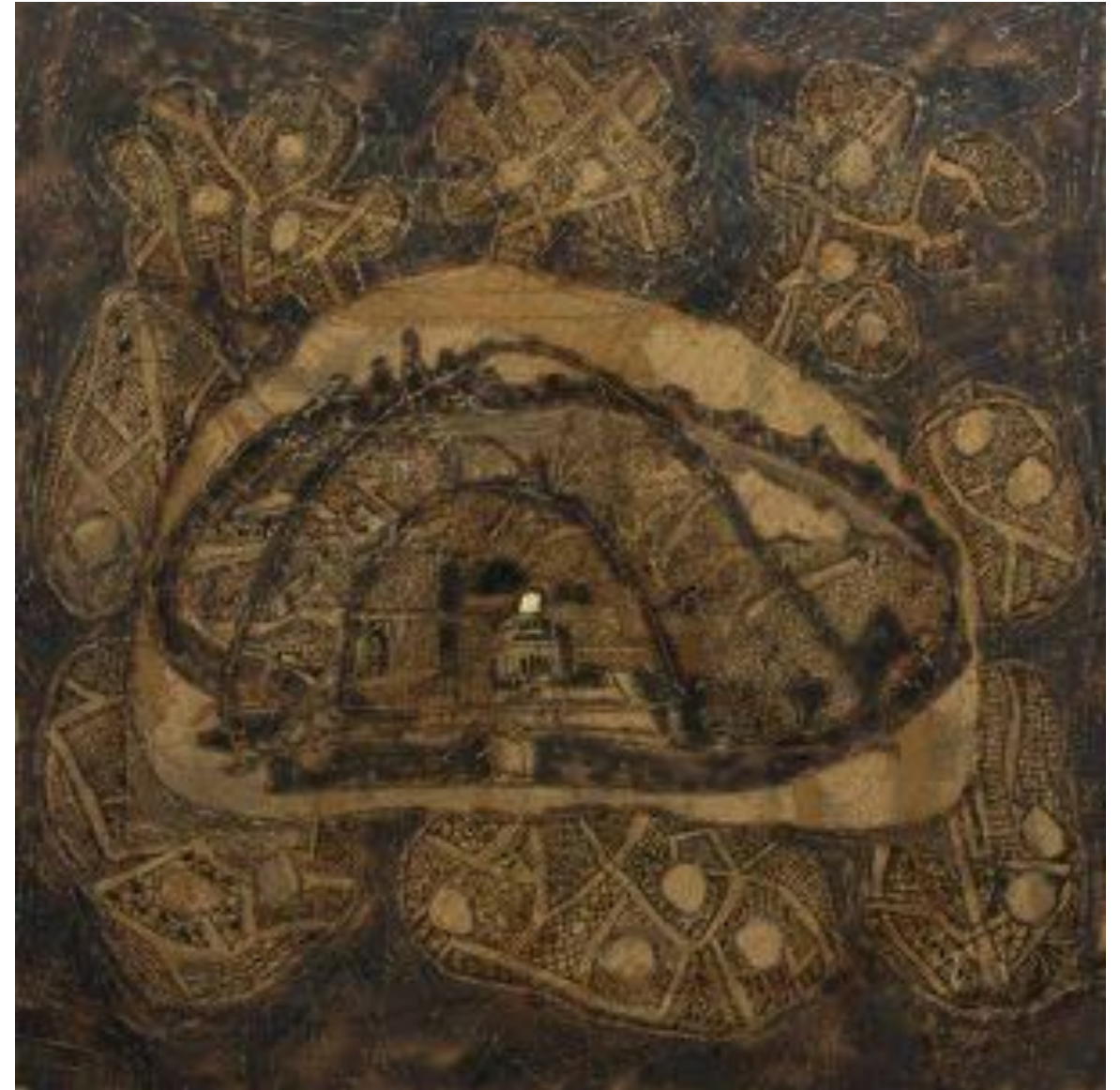
950sq.m. No. 16, 2017 < 950 מ"ר מס' 16, 2017