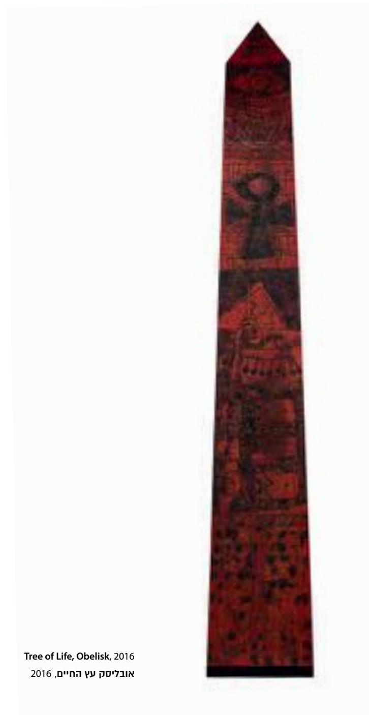
Tree of Life, Obelisk, 2016 אובליסק עץ החיים, 2016