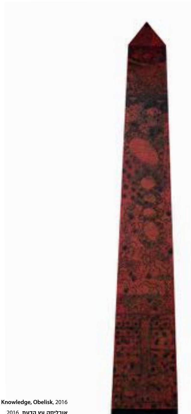
Tree of Knowledge, Obelisk, 2016 אובליסק עץ הדעת, 2016